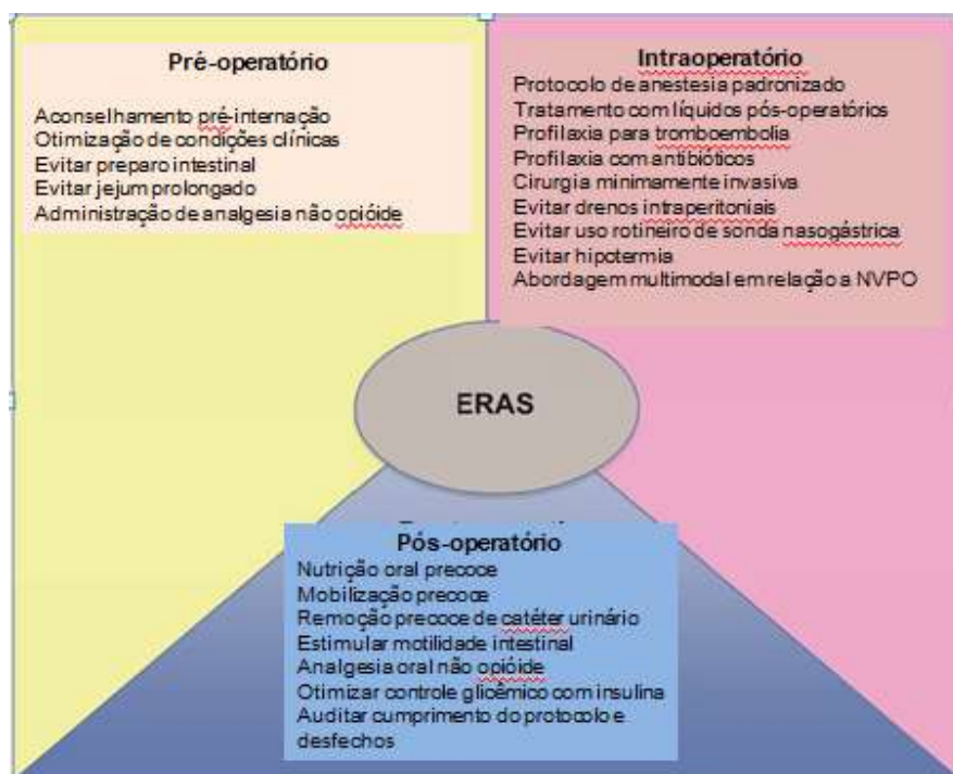
Figura. Componentes de Recuperação Otimizada Após Cirurgia. NG, nasogástrico; NVPO, náusea e vômito pós-operatório

CME). O tempo estimado de realização do exame é 01 (uma) hora. Favor registrar o tempo gasto e relatar ao seu órgão credenciador se desejar obter pontos de CME. Será emitido um certificado ao passar no exame. Ver política de credenciamento aqui here .